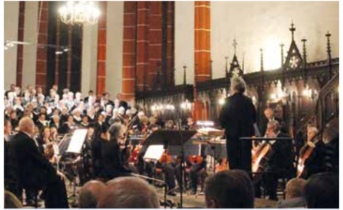
Festkonzerte in den Kirchen in Saalfeld und Rudolstadt am 9. November