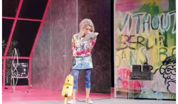
Uraufführung im Theater Rudolstadt: „Hilfe die Mauer fällt“