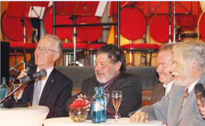
Festakt der Landkreise in Probstzella mit Zeitzeugen aus Ost und West