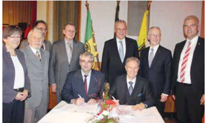
Bekräftigung der Kreispartnerschaft mit dem Landkreis Kronach