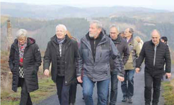
Delegation aus Trier-Saarburg auf dem Weg zur Thüringer Warte