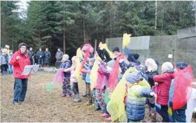
Grundschule Lehesten-Aktion am 9. November am ehemaligen Grenzzaun

Fotoimpressionen von den Veranstaltungen zu 30 Jahren Grenzöffnung im Landkreis Saalfeld-Rudolstadt