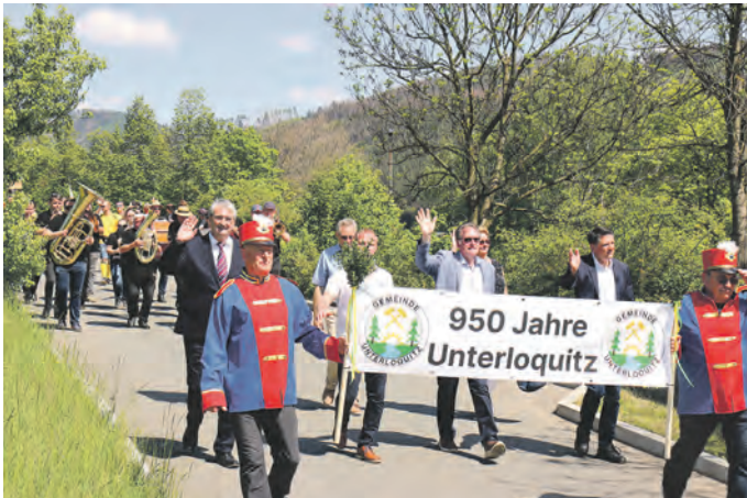
An der Spitze des Umzugs laufen Landrat, Bürgermeister und MdL

heutige Sitz des Landratsamtes. Den Auftakt zum Jubiläumsjahr 950 Jahre Ersterwähnung machte Anfang Mai Unterloquitz mit einer Festwoche. Vom historischen Festumzug mit etwa 300 Teilnehmern geben wir hier einige Eindrücke.