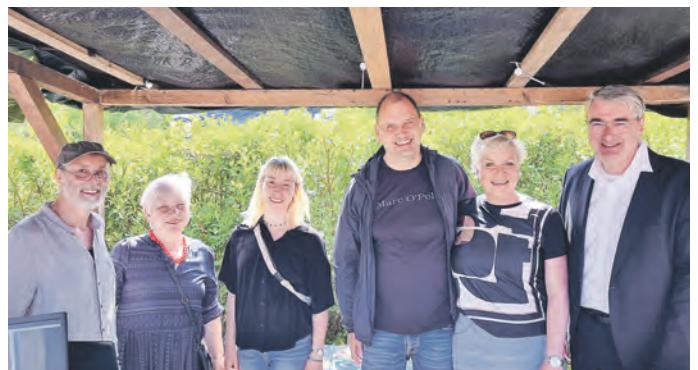
Am Stand des Kom-In-Netzwerks: 1994 war das Kom-In-Netzwerk aus Unterloquitz-Arnsbach in das Vereinsregister eingetragen worden. Zum Abschluss der Festwoche präsentierten sie sich auf dem Festplatz mit ihrem Angebot von Blindenhörzeitschriften und den Möglichkeiten digitaler Teilhabe