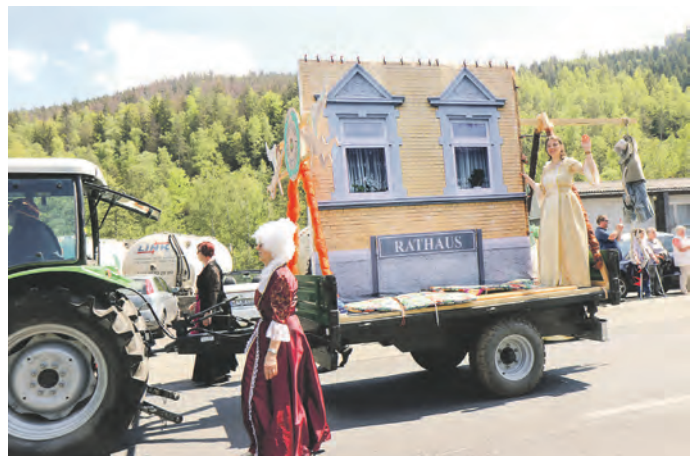
Die Druidensteiner aus Oberloquitz präsentieren sich