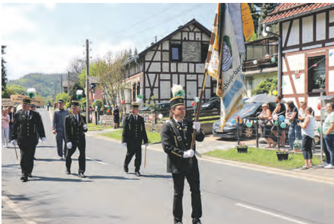
Erinnerung an die große Bergbau-Tradition der Schiefergruben