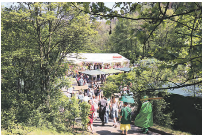
Blick auf den Festplatz neben der ehemaligen Schule